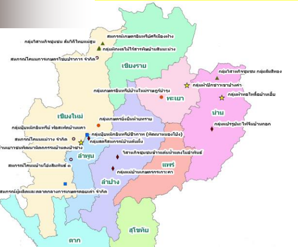
การศึกษาวิจัยครอบคลุมพื้นที่ 5 จังหวัด ได้แก่ เชียงใหม่ ลำพูน ลำปาง พะเยา และน่าน ซึ่งเป็นเขตเศรษฐกิจวัฒนธรรมที่สำคัญของภาคเหนือตอนบน